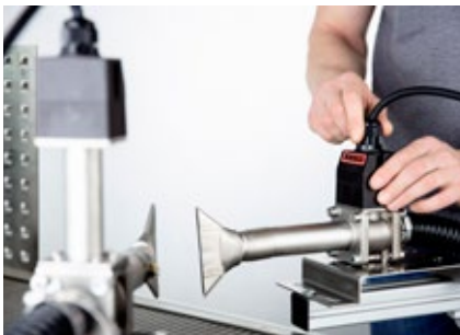
Leicht in industrielle Prozesse integriert

Die kleinen Single-Flange-Luftherhitzer lassen sich leicht in industrielle Anlagen mit wenig Platz integrieren. Sie sind mit diversen Düsen kompatibel und in vielen industriellen Prozessen einsetzbar. Die Serie SF-R eignet sich für viele industrielle Prozesse, in denen Heissluftrückführung benötigt wird.