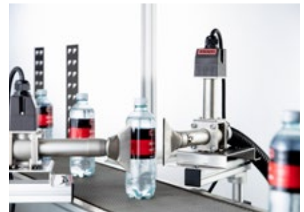
Kompatibel mit diversen Düsen