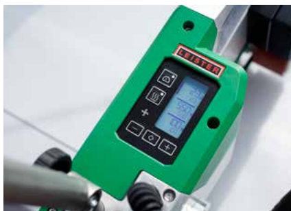
Paramètres de soudage réglés

La machine à souder automatique compacte UNIROOF 300 convient parfaitement pour le soudage de toits plats de taille moyenne à grande et est idéale comme machine d'entrée de gamme en raison de sa simplicité d'utilisation.