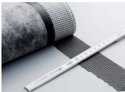
Buse standard pour une largeur de cordon de soudure optimale