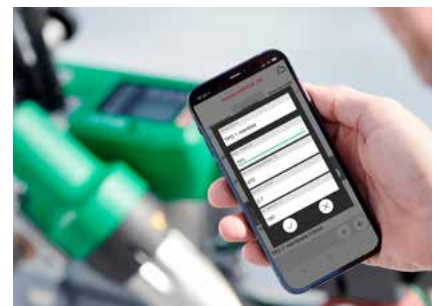
Schweißrezepte in der myLeister-App